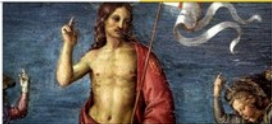
L'incontro con Cristo in tempo di isolamento